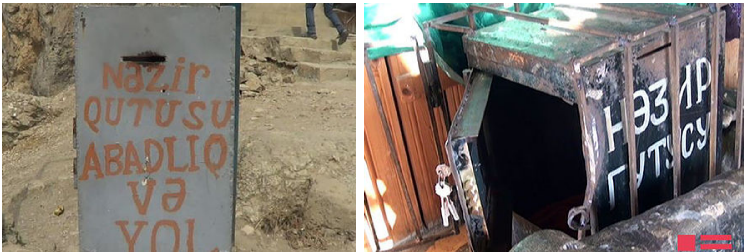
Nəzir qutusunun üstündə yazılıb - Yolun tikintisi üçün Allah yolunda nəzir ver