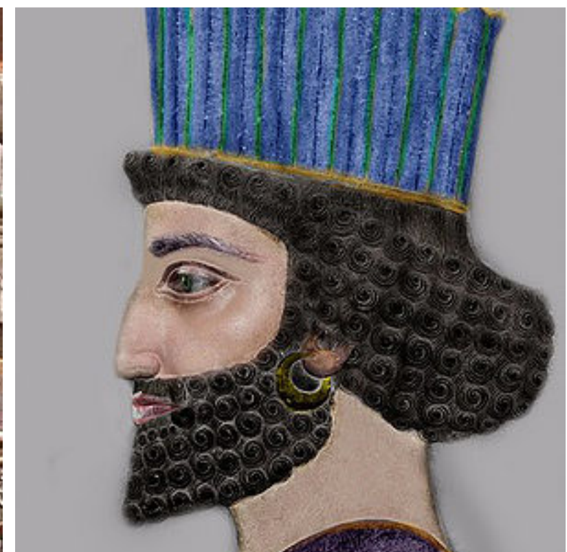
Persepolis in Shiráz where masses of people came to pay respect to the King and offer contributions